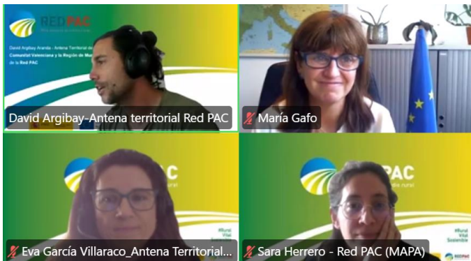
Fotografía 1: Presentación de la jornada de promoción de los premios de Inspiración Agraria y Rural (ARIA) 2026.

El pasado 13 de mayo tuvo lugar la jornada de promoción de los ARIA 2026 de la Red Europea de la PAC. El evento se desarrolló en modalidad “on-line” a través de la plataforma Zoom y contó con la participación de 66 personas interesadas en conocer mejor y resolver sus dudas sobre la presentación de proyectos para esta nueva convocatoria. En esta ocasión, se aprovechó no sólo para explicar las novedades respecto a los requisitos de inscripción, proceso de solicitud y criterios de valoración, sino también para invitar a ganadores y finalistas de ediciones anteriores de los premios RIA (antecesores de los ARIA) y ARIA y así conocer sus experiencias y beneficios tras haber participado en estos premios.