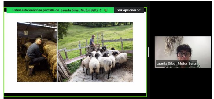
Fotografía 7: Laura Siles Ceballos, con el proyecto Muttur Beltz, de País Vasco.

de transformación del medio rural. Señaló que el premio permitió dar visibilidad a su proyecto y reforzar la idea de que la cultura también es clave para generar nuevas ruralidades y oportunidades en el territorio.