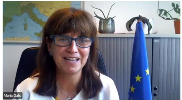
Fotografía 2: Inauguración de la jornada por parte de María Gafo, jefa de la unidad “Sostenibilidad Social” (DG AGRI, Comisión Europea).

jefa de la unidad “Sostenibilidad Social” (DG AGRI, Comisión Europea), que se centró en la importancia de la igualdad de género y el relevo generacional como prioridades estratégicas para el futuro del medio rural europeo y de la Política Agraria Común (PAC).