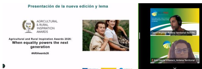
Fotografía 4: Presentación de los Premios ARIA 2026.

Finalmente, se puso en valor los beneficios de participar en los premios, tanto a nivel nacional como europeo. La Red PAC utilizará los proyectos recibidos en jornadas, publicaciones y acciones de difusión, mientras que la Red Europea de la PAC dará visibilidad internacional a los finalistas mediante publicaciones, redes sociales y eventos europeos, además de facilitar oportunidades de colaboración y reconocimiento para las iniciativas seleccionadas.