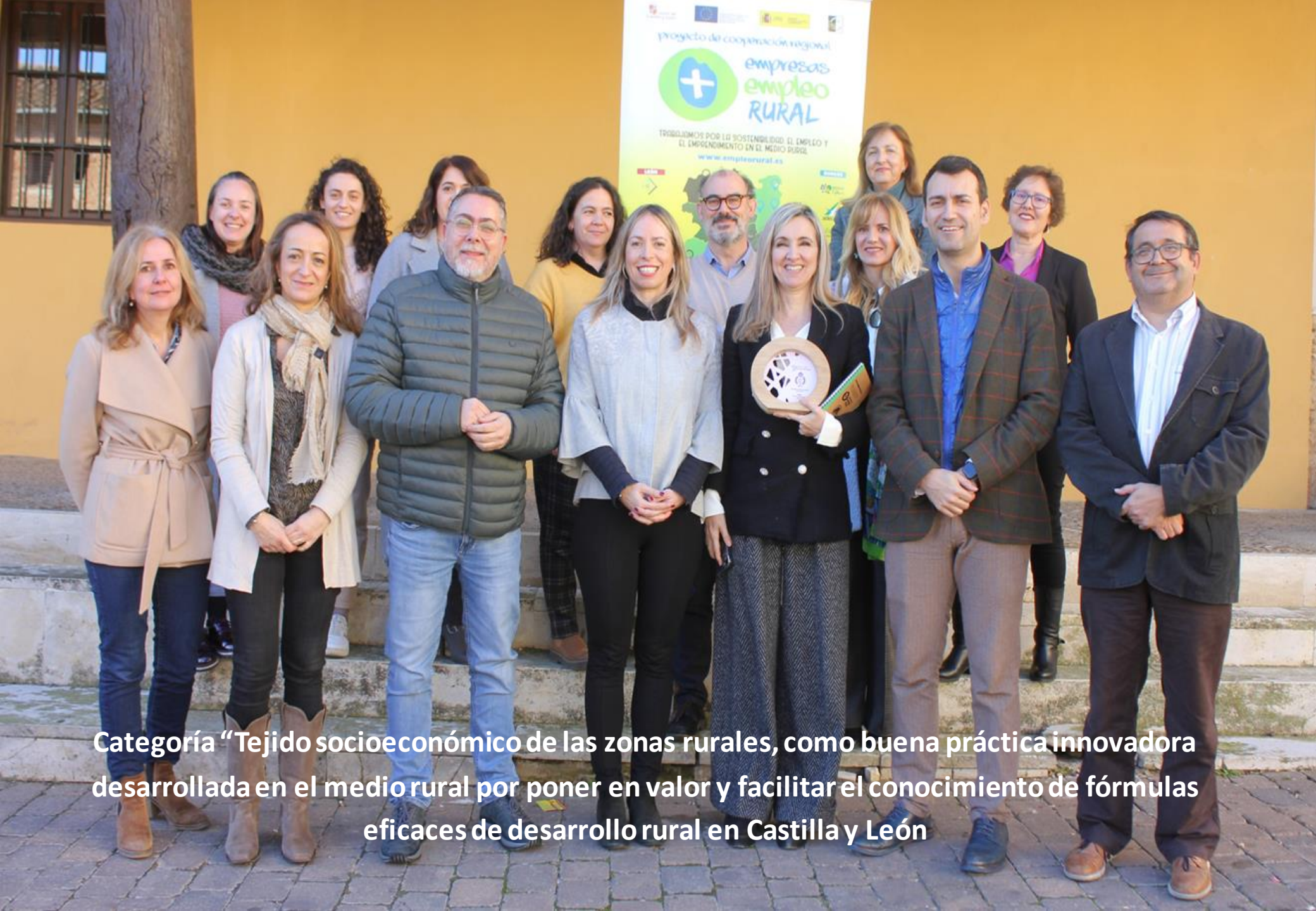
Categoría “Tejido socioeconómico de las zonas rurales, como buena práctica innovadora desarrollada en el medio rural por poner en valor y facilitar el conocimiento de fórmulas eficaces de desarrollo rural en Castilla y León